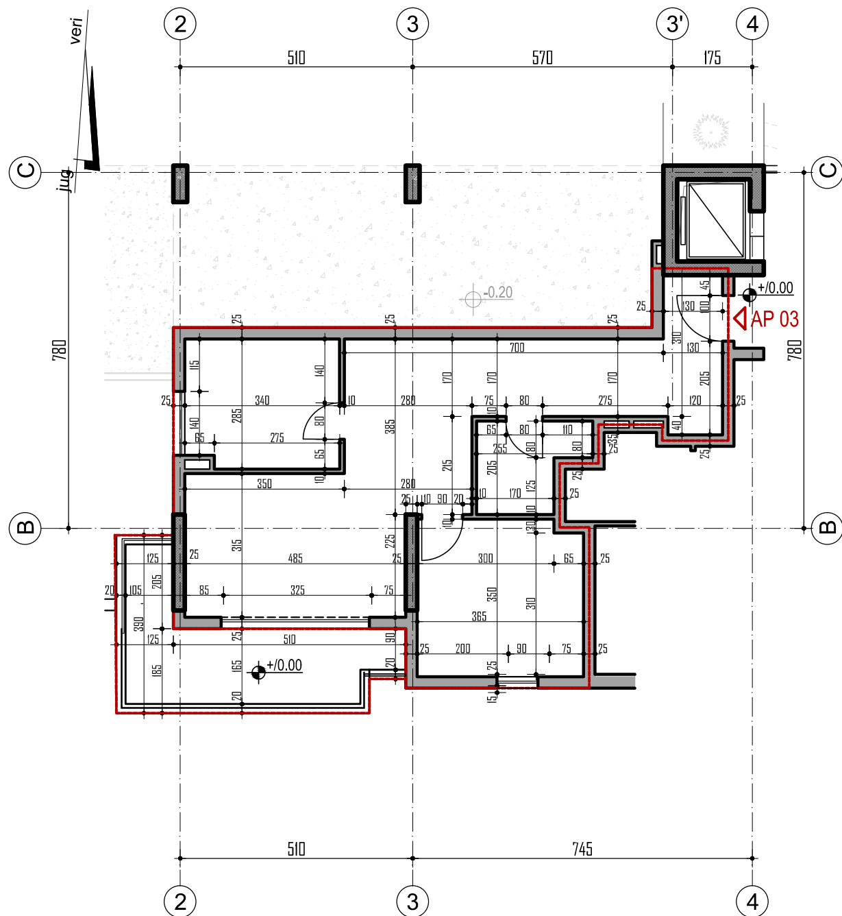
plan i apartamentit NR 03 (2+1) (kuota +/-0.00) sh 1:100