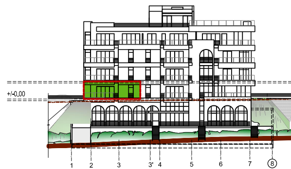
pamje nga jugu